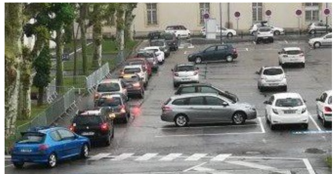
Bouchon à la cité administrative de Nancy ! Les agents bloqués sur leur lieu de travail !

Malgré nos efforts, cette dernière a rejeté notre demande.