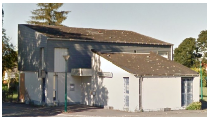
Trésorerie de Vimy