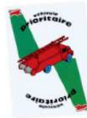
DÉLAI RÉDUIT EN CAS DE SITUATION PRIORITAIRE