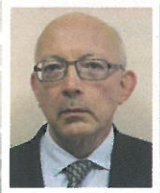
Didier COURTOIS DGFIP