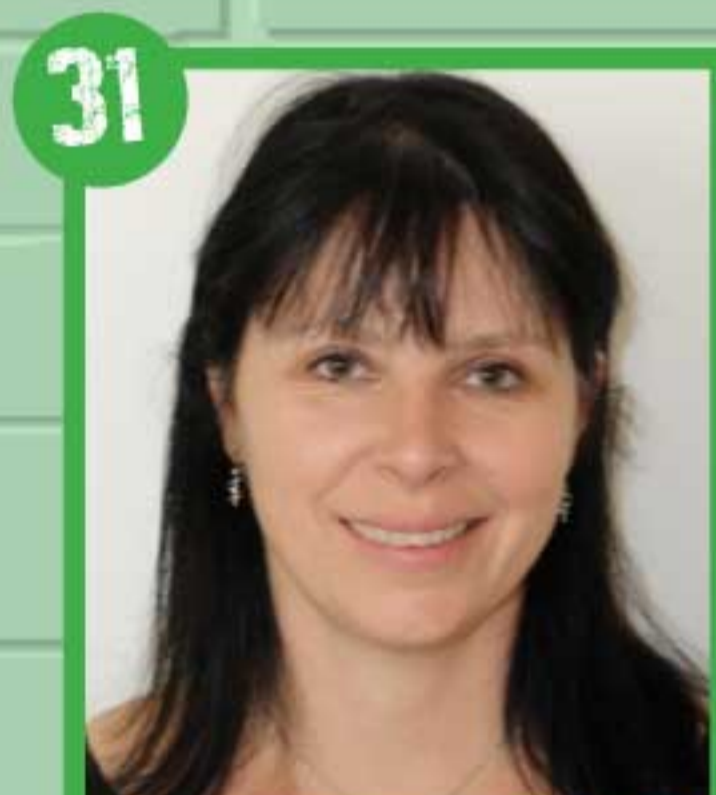
31 FLORENCE ALVINERIE RF TOULOUSE MLE