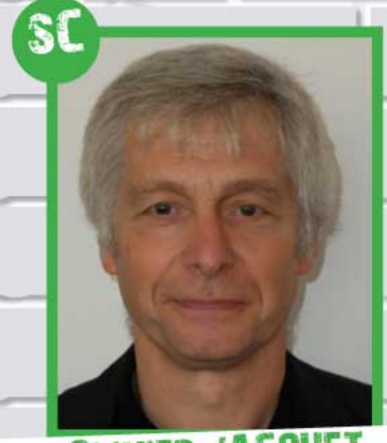
SC OLIVIER JACQUET SERVICES CENTRAUX