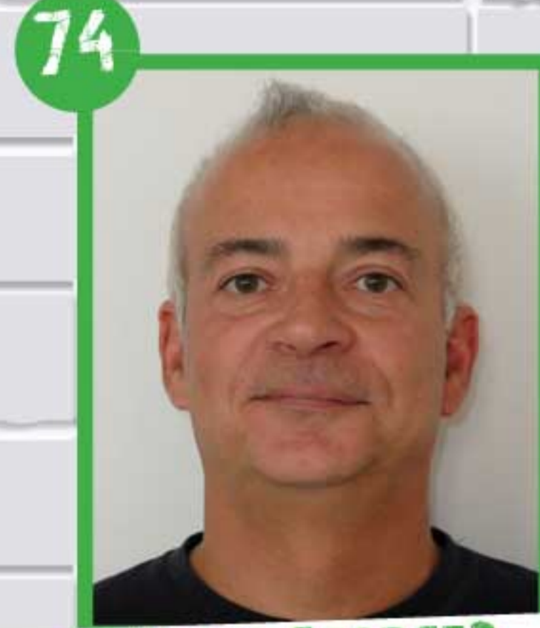
74 MARC GEORGES PCE ANNEMASSE ET THONON