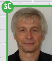
SC OLIVIER JACQUET SERVICES CENTRAUX