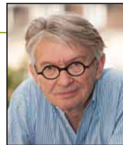
FO Hebdo - F. Blanc

PAR JEAN-CLAUDE MAILLY, SECRÉTAIRE GÉNÉRAL