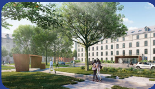
Croisement des cheminements piétons et signalétique extérieure