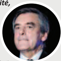
François Fillon devant les patrons le 10 mars 2016

« Le système par points, en réalité, ça permet une chose qu'aucun homme politique n'avoue : ça permet de baisser chaque année le montant des points, la valeur des points, et donc de diminuer le niveau des pensions. »