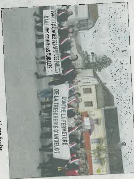
La mobilisation du 26 mars a porté ses fruits.

Cette fois c'est officiel, le contrat est signé entre le ministère de la Défense et le fabricant retenu. (Lire aussi en page 32). Fournis par Sagem, les quatorze premiers drones seront livrés à l'armée française en 2018. Air 61 re RA de Semoulliers, les premiers