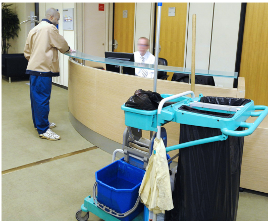
UNITÉ DE TRAVAIL A08 « Personnel d'entretien et de ménage »