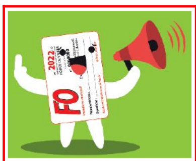
Bernadette PHILIPS Secrétaire départementale

FO DGFIP - Section de l'Oise 2 rue de Molière 60000 BEAUVAIS