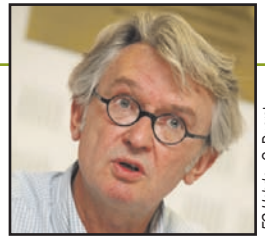
FO Hebdo - G. Ducrot

PAR JEAN-CLAUDE MAILLY, SECRÉTAIRE GÉNÉRAL