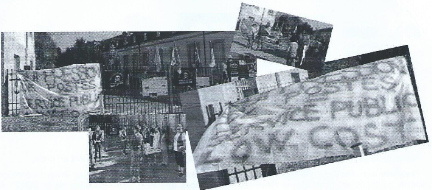
FONTAINEBLEAU contre un service public « low cost »