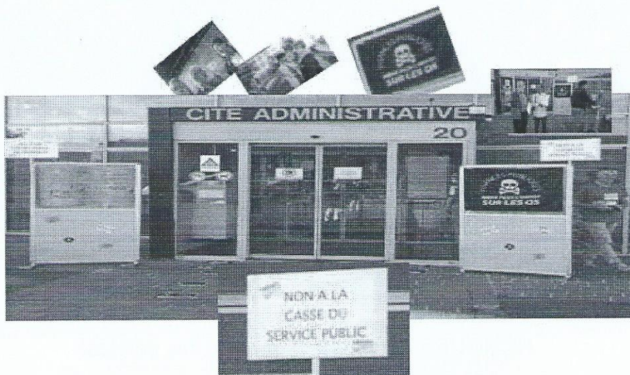
MELUN même plus l'impôt sur les os !