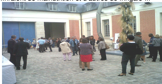
une foule clairsemée 20 min à peine après la fin du discours

Les nouveaux agents qui n'avaient pas mangé la veille, sur la foi du témoignage d'anciens briscards des buffets froids, souffriraient de malnutrition et d'autres de fringale !!!