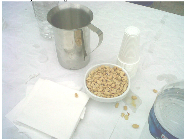
Bol de cahouètes

Après avoir expliqué, cartes et superbes coloriages à l'appui, que les Yvelines était le département le plus riche en terme d'impôt sur le revenu après Paris Ouest et pour compenser sans doute l'aménagement à grand frais des bureaux de Jésus le quatrième, la DDFIP 78 fauchée comme les blés en été a viré Paul Bocuse pour un buffet low cost (surement la RGPP...) Une virée au LIDL du coin, une ou 2 cahouètes, un verre de jus d'orange (à base de concentré) ou d'eau pétillante (de marque tout de même, c'est fou) c'est circulez y-a rien à grailer !