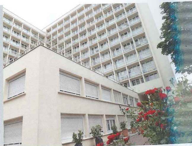
A droite : Issy-les-Moulineaux (92130) Foyer Ernest Renan Association « Résidence des jeunes »