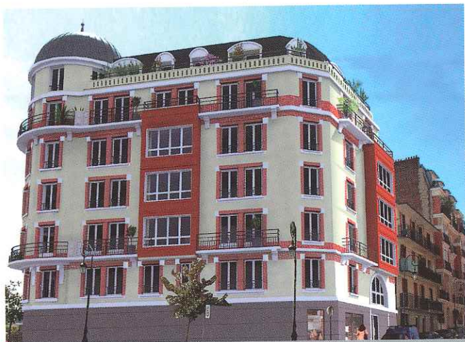
Puteaux (92) rue Fernand Pelloutier 25 logements réservés par l'ALPAF Société : «Clavis conseil»