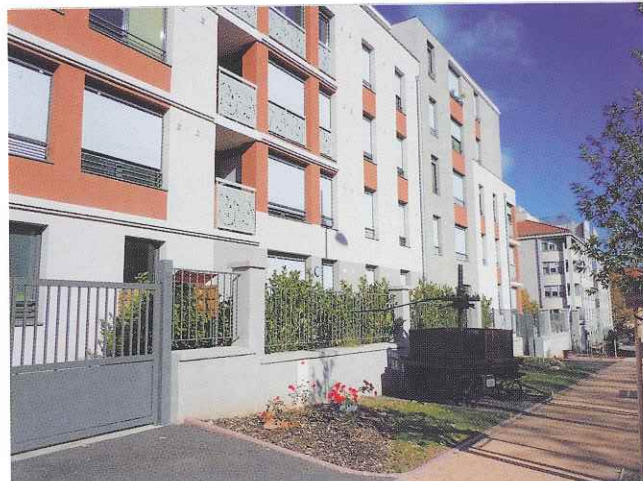
A gauche : Caluire et Cuire (69300) Société Immobilière Rhône-Alpes

Taux de rotation Sur le parc francilien 9,49 % des logements ont été libérés au cours de l'année 2015.