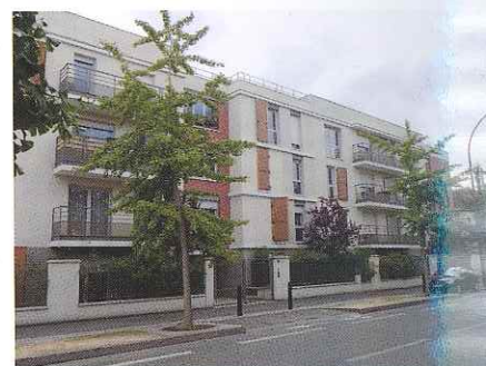
L'Hay-les-Roses (94) 8/22 rue Henri-Barbusse 10 logements réservés Société «RLF»

Sur ces 949 attributions, plus de 92 % des usagers ont obtenu leur logement moins de 6 mois après avoir déposé leur demande.