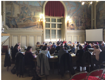
La commission plénière de la SRIAS est présidée par le Président, et se déroule en présence du Préfet de Région ou du Secrétaire Général pour les affaires Régionales

Le Président réunit chaque commission en tant que de besoin au cours de l'année pour faire le bilan des actions et examiner les actions à entreprendre.