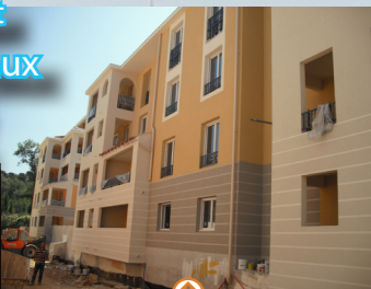
La résidence La Tourache à Grasse (Alpes-Maritimes)