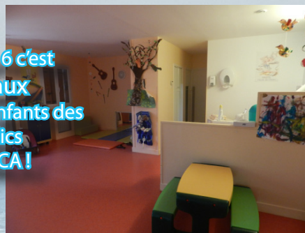
La crèche «Les Lucioles» à DIGNE (Alpes de Haute Provence)

La SRIAS en 2016 c'est 328 berceaux réservés pour les enfants des agents publics en région PACA !