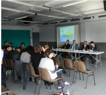
La commission plénière de la SRIAS PACA élabore un plan d'action régional.

La SRIAS PACA est une commission paritaire chargée de la mise en oeuvre, au niveau régional, des prestations interministérielles d'action sociale, individuelles ou collectives, visant à améliorer, directement ou indirectement, les conditions de travail et de vie des agents de l'Etat et de leurs familles.