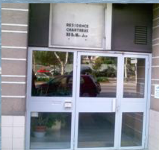
La résidence Alotra aux Chartreux à Marseille.

Cette résidence propose des logements provisoires à tous les fonctionnaires : personne seule ou couple, avec ou sans enfant, ayant le statut de fonctionnaire d'Etat et rencontrant des difficultés temporaires pour se loger.