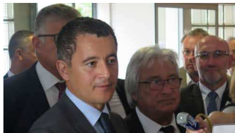
Gérald Darmanin au centre des impôts de Poitiers mercredi 31 octobre