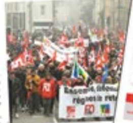
Fortes mobilisations des salariés précaires