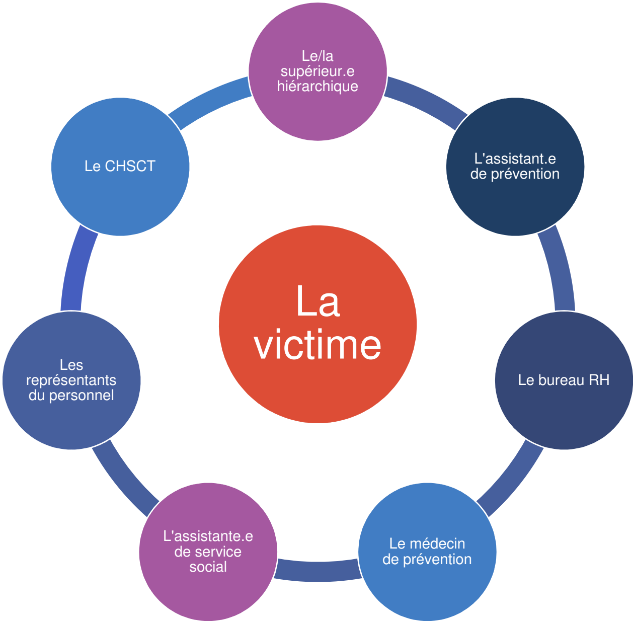
Schéma des intervenants qui peuvent être sollicités dans une situation de violence sexiste ou sexuelle