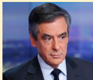
François Fillon devant les patrons le 10 mars 2016 (Public Sénat)

« Le système par points, en réalité, ça permet une chose qu'aucun homme politique n'avoue : ça permet de baisser chaque année le montant des points, la valeur des points, et donc de diminuer le niveau des pensions. »